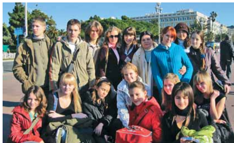
На снимке: участники фестиваля «Серебряный дельфин» в Ницце