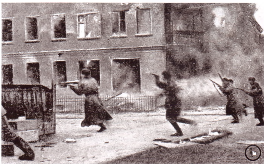
Штурмовая группа на улицах г. Городок. Декабрь 1941 г.

В октябре – декабре 1943 г. 84-я гв. стрелковая дивизия участвовала в Невельско-Городокской операции; к 23 декабря 1943 г. (совместно с другими воинскими подразделениями) было освобождено 94 населенных пункта. 24 декабря 1943 г. с боем взят г. Городок. В июне – июле 1944 г. в рамках операции «Багратион» дивизия принимала участие в освобождении населенных пунктов Белоруссии Орша, Борисов, Радосшковичи, Молодечно, Ошмяны.