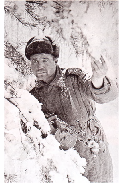
Красноармеец в дозоре. Окрестности г. Городок. Декабрь 1943 г.