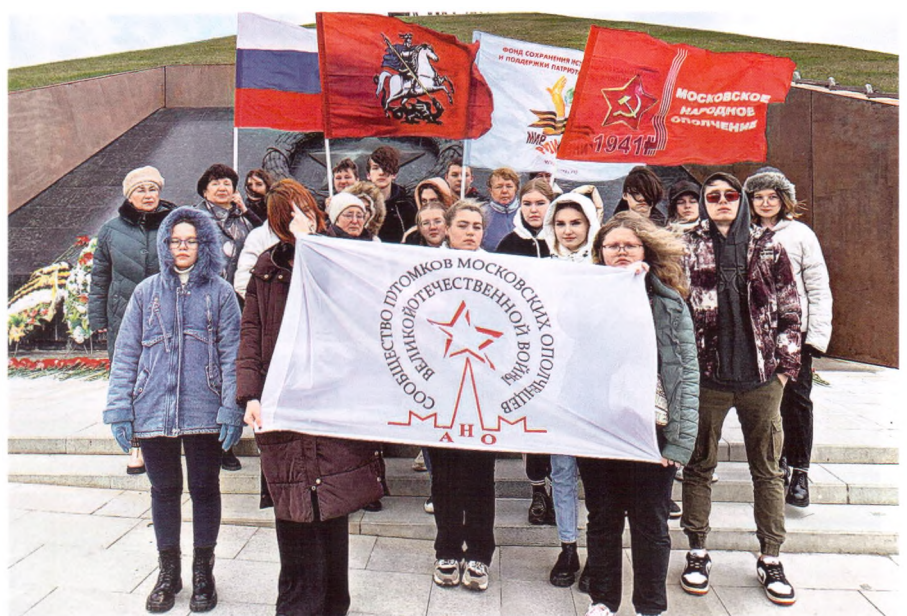
Экспедиция по местам боев ополченческих дивизий. Октябрь 2022 г.