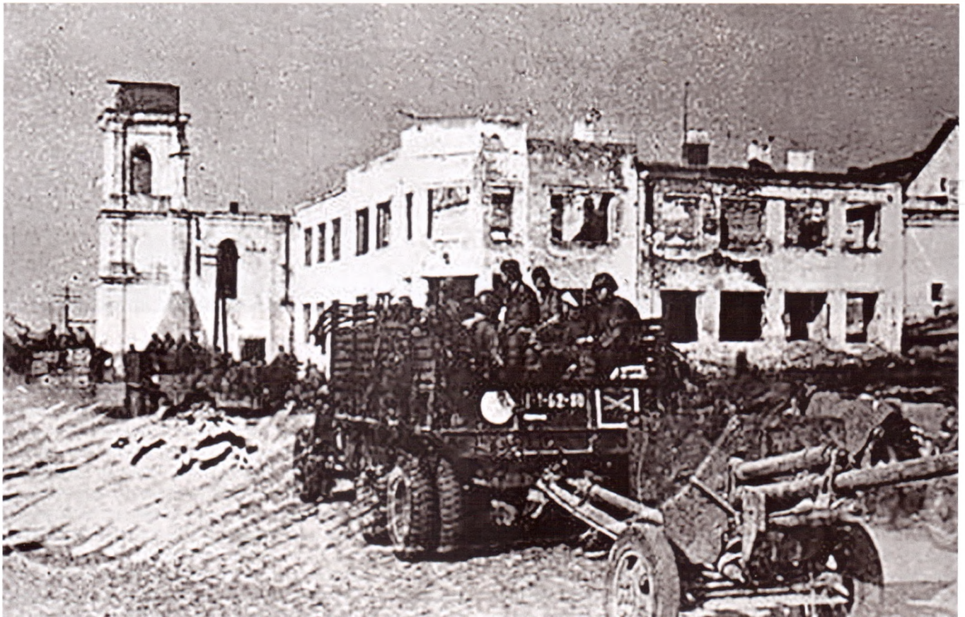
Советские войска вступают в освобожденную Оршу. Июнь 1944 г.