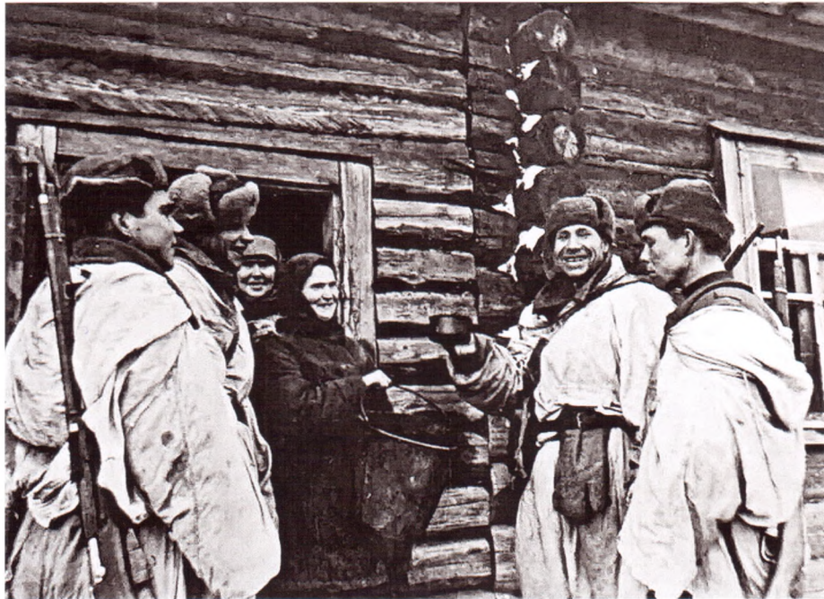
Мирные жители встречают бойцов Красной армии. Городок. Декабрь 1943 г.