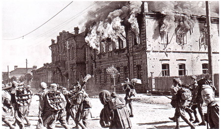
Освобождение г. Борисов. Июль 1944 г.