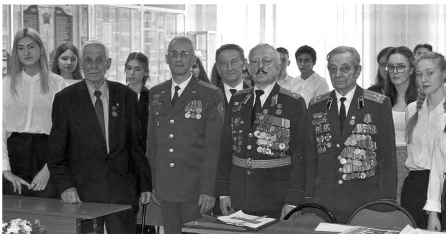
Классный час "Жить – Родине служить", посвященный Дню защитника Отечества. "Музей боевой славы РМАТ". 20 февраля 2020 г.

Родину, готовых ради нее на подвиг. Это делает музей мемориальным – предназначенным хранить память об ополченцах химкинского батальона.