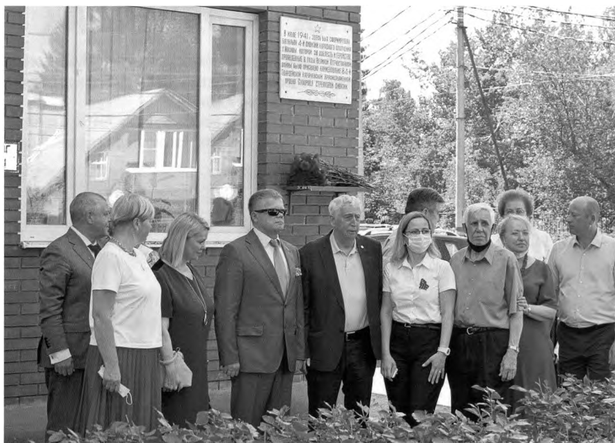
6 июля 2021 г. – День народного ополчения. Участники круглого стола у мемориальной доски, посвященной химкинским ополченцам.