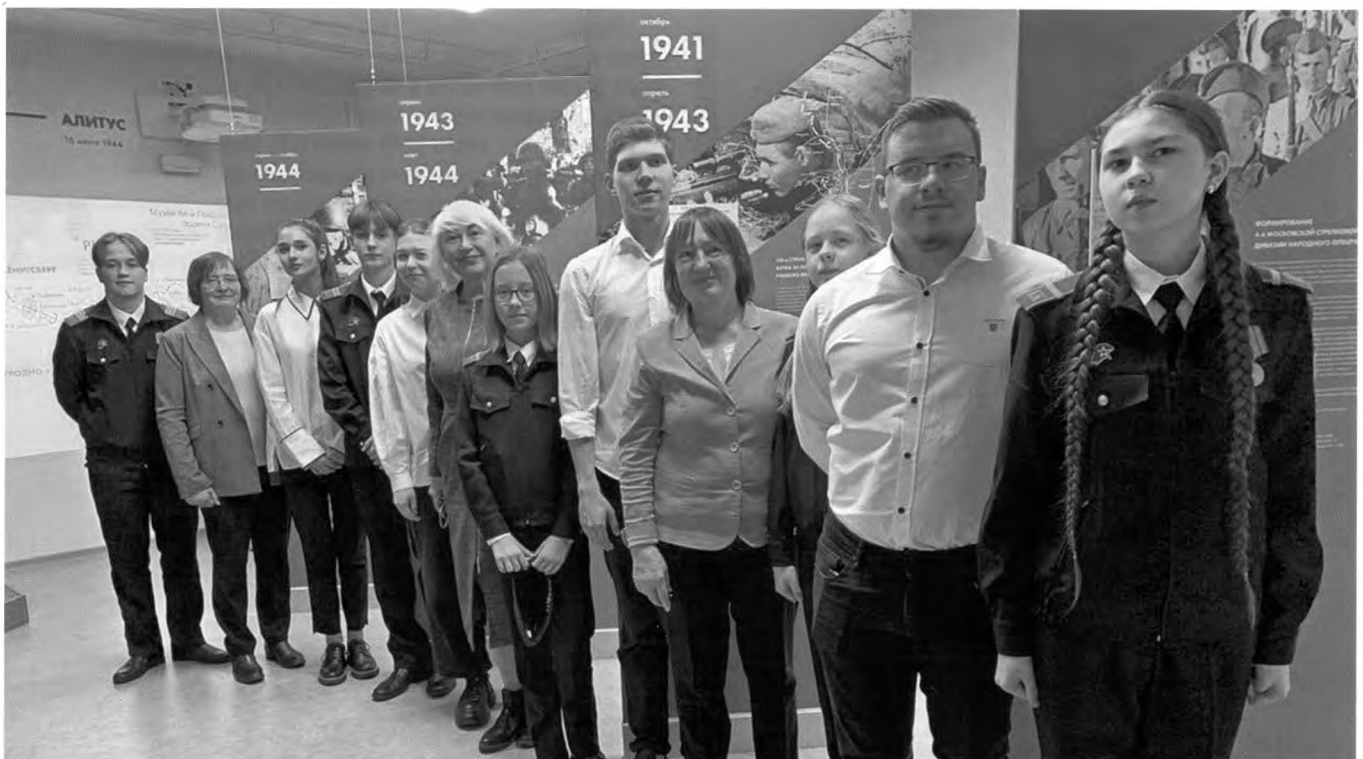
Активисты "Музея Боевой славы РМАТ" в Калининградской школе № 28. 23 октября 2021 г.