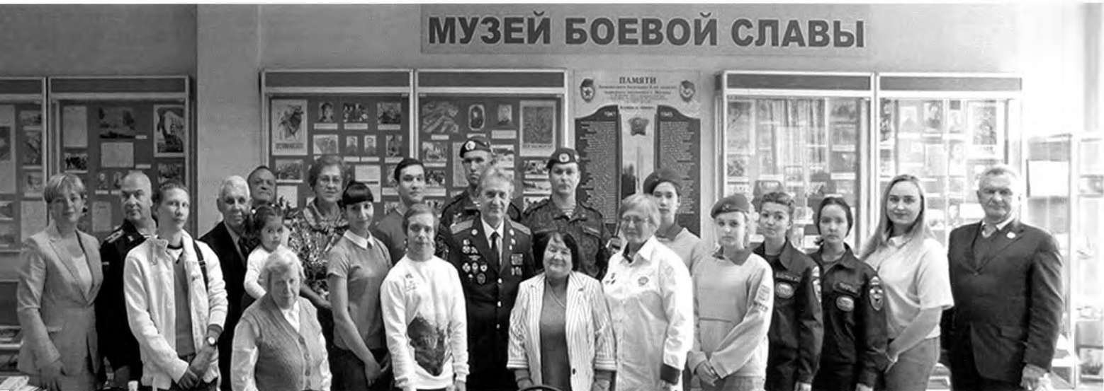
Участники круглого стола "Они отстояли Москву по зову сердца и велению совести". 4 июля 2019 г.