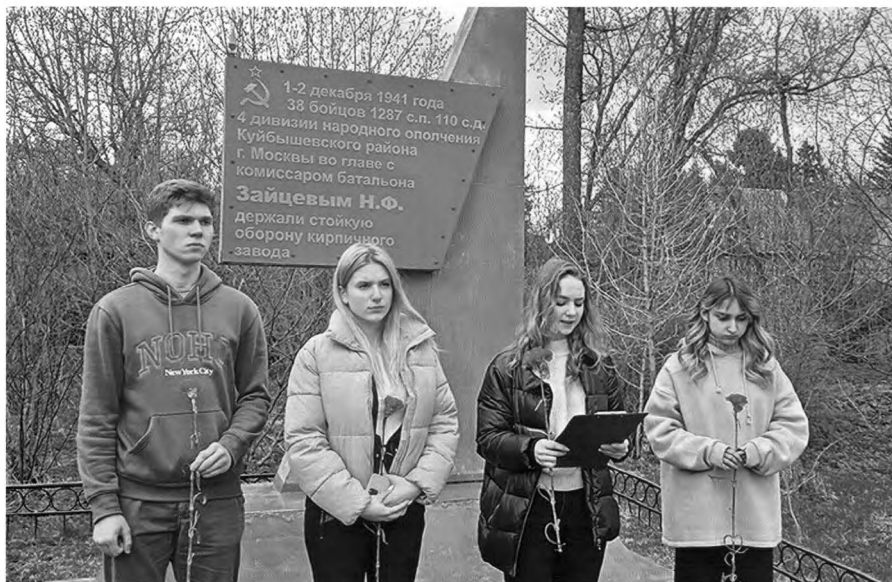
Участники экскурсии-акции "Рубежи воинской доблести 4-й дивизии народного ополчения". Памятный знак у деревни Горчухино Наро-Фоминского района Московской области. 29 апреля 2021 г.