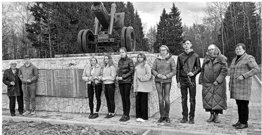
Участники экскурсии-акции "Рубежи воинской доблести 4-й дивизии народного ополчения". Памятник-пушка на 75-м километре Киевского шоссе. 29 апреля 2021 г.

Музей питает энергетика места – память об июле 1941 г., о грозных событиях первых дней войны, о людях, беззаветно любивших свою