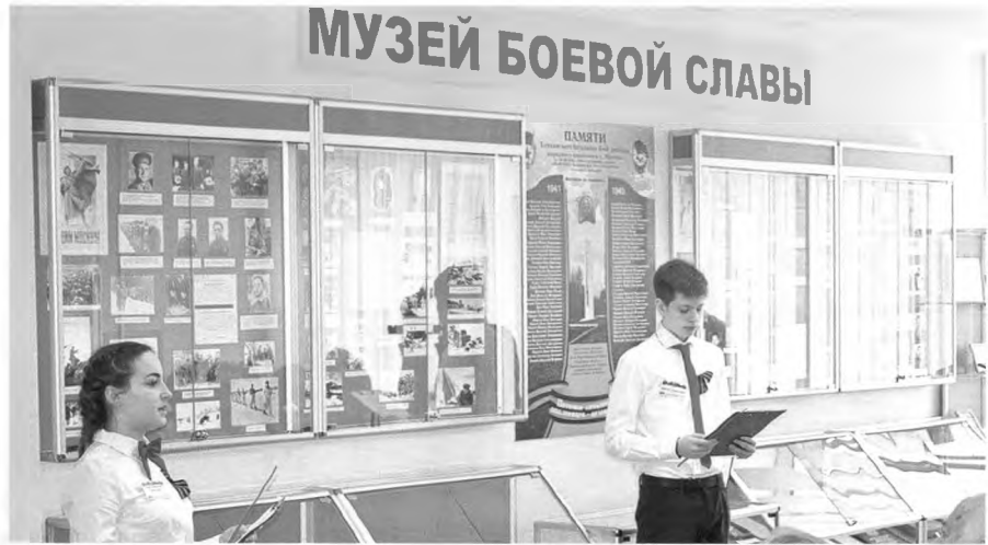
Первая экскурсия в "Музее боевой славы РМАТ". 7 мая 2019 г.

моотверженного подвига – во имя Родины, народа, его свободы и независимости.