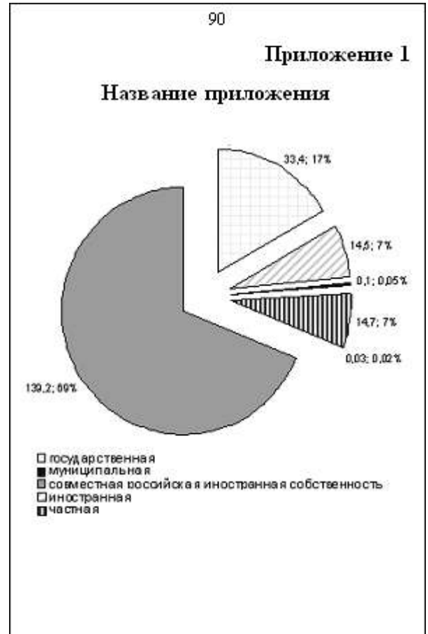
Рис. 2. Оформление приложений