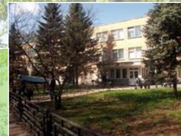
West - Moscow region tourism institute