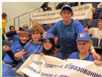
Voskresensk tourism institute