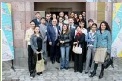
Armenian tourism institute